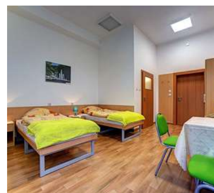
Pokój Szpitalu „EXCELSIOR