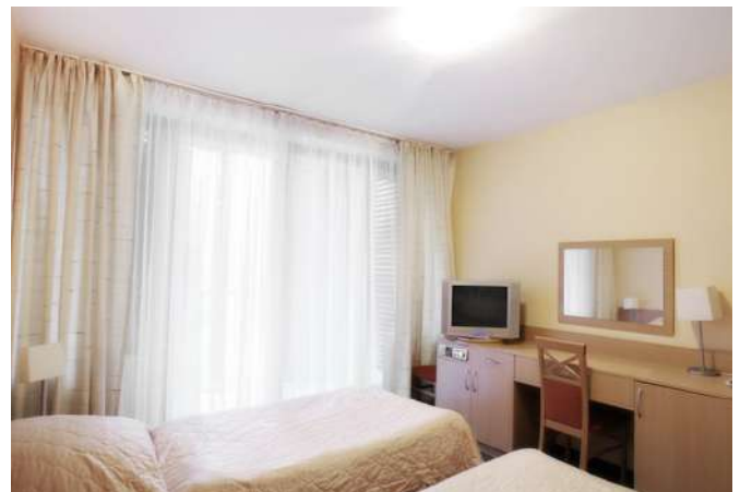
Pokój Jesienna Rezydencja