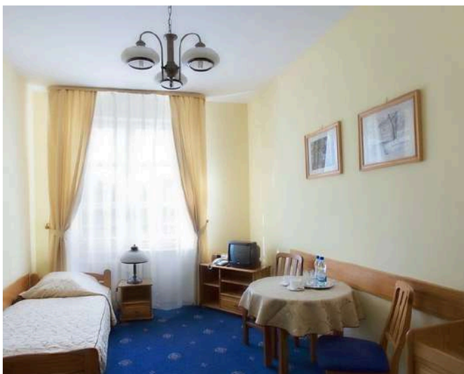
Pokój Książę Józef