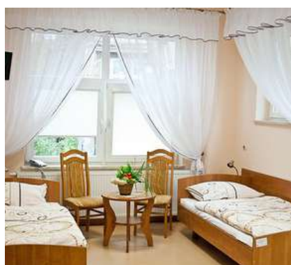
Pokój Sanatorium Uzdrawiskowe Nr IV