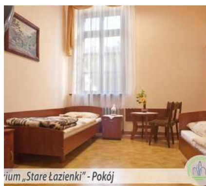
Pokój Sanatorium Stare Łazienki