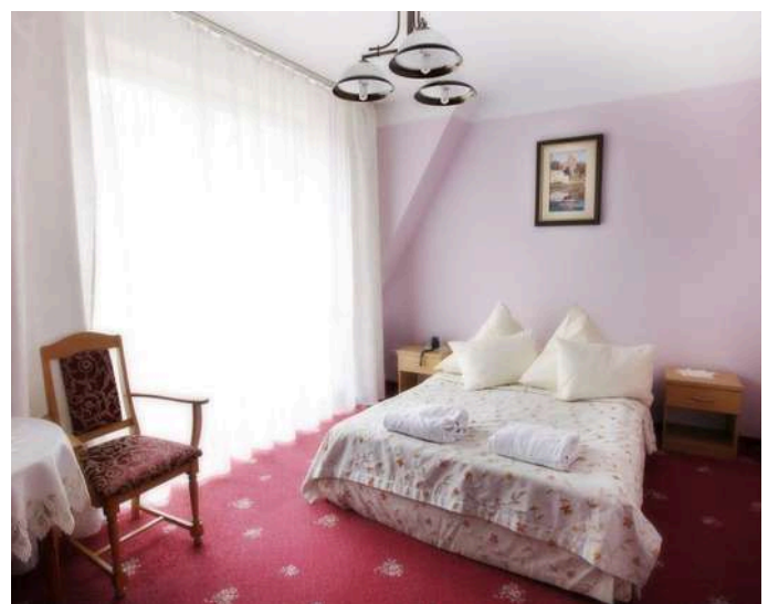
Pokój Pawilon Angielski